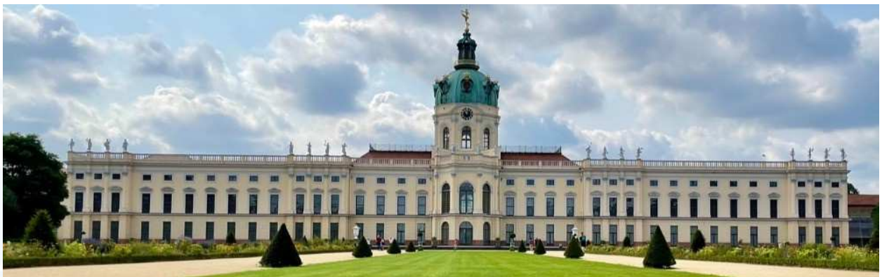
Château de Charlottenburg Dîner libre et nuît à l'hôtel.

inclus autocar, guide francophone et entrée château et jardin